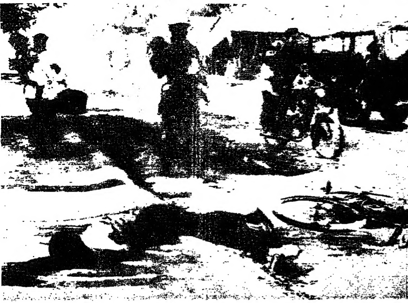
مواطنون من مدينة «داتونغ» في فيتنام يتساقطون للمخرج من المينة التي تحمل بها العرب بعد ان اجتاحها رجال «فيتكونغ» في الصورة سيارة «جيب» اعطيت القوار ، ويرى سائقها ميتا بالقرب منها

يحدد المرتب عند البداية حسب المراتب والخبرة والقوانين